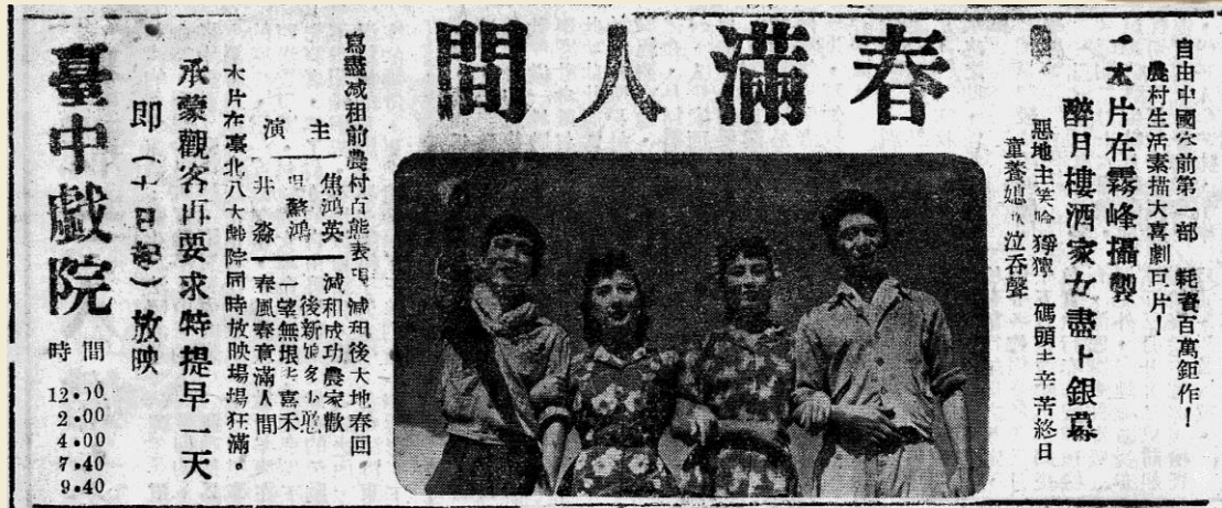
臺灣民聲日報社_〈春滿人間〉

1952年，「中國電影製片廠」（1949年遷臺，屬國防部），拍攝完成《春滿人間》，以國民政府實施「三七五減租」造福臺灣農民為題，歌頌德政。